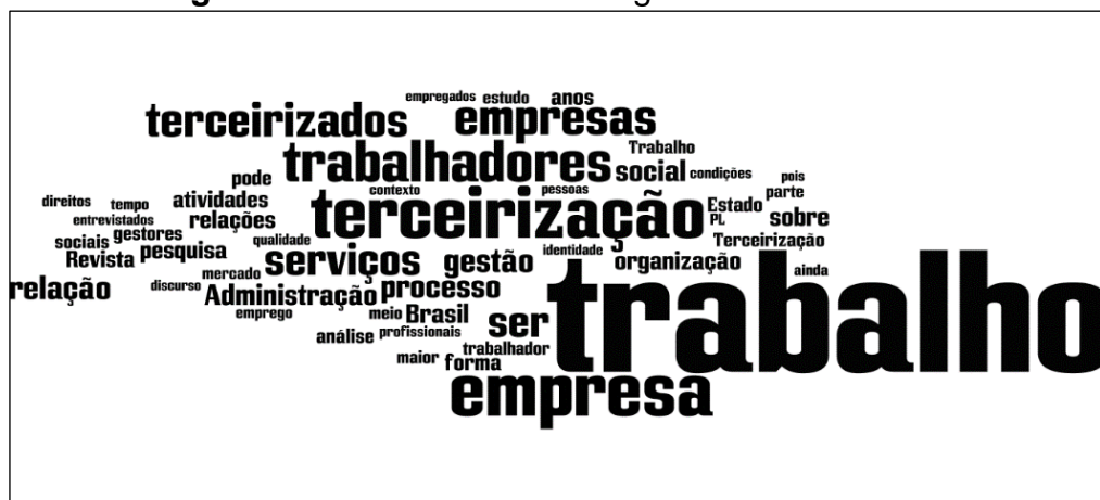
Figura 2 – Word cloud dos artigos considerados